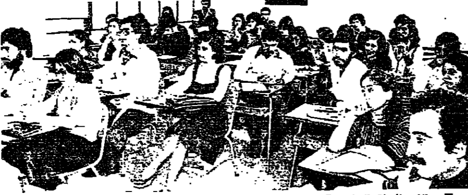
طلاب السنة الاولى